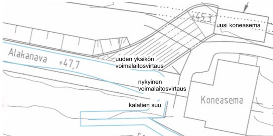
Kuva 5. Uuden koneaseman virtauksen sijainti suhteessa nykyiseen koneasemaan ja kalatiehen.

Rakennusvirtaaman kasvun myötä nykyistä suurempi osa joen virtaamasta kulkee olemassa olevan alakanavan kautta ja ohijuokсутusten määrä vähenee. Alakanavan levennyksen ja syventämisen seurauksena virtausnopeudet alakanavassa pääosin laskevat.