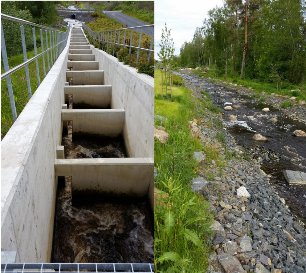
Kuva 3. Korpelan kalatien tekninen yläosa sekä luonnonmukainen keskiosa.