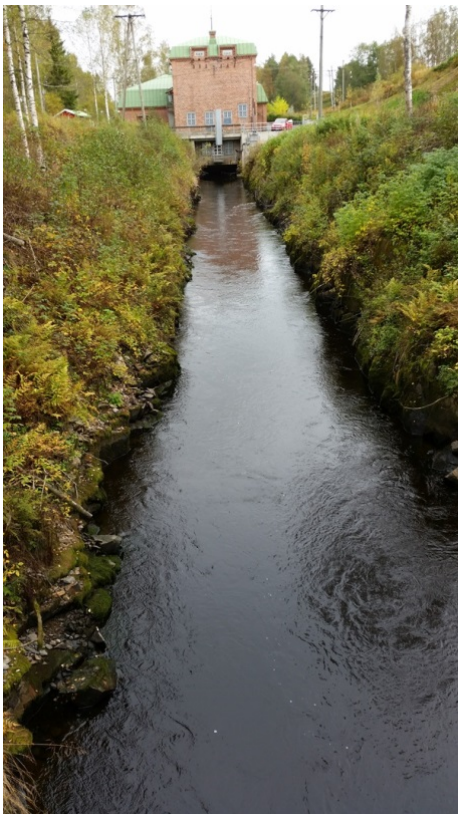
Kuva 4. Voimalaitoksen alakanava.